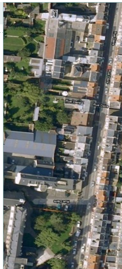
Rue Daire, AMIENS

Le SMPS Picardie veillera à ce que cette réunion ait des suites concrètes, l'ARS reconnaissant l'intérêt de ces rencontres.